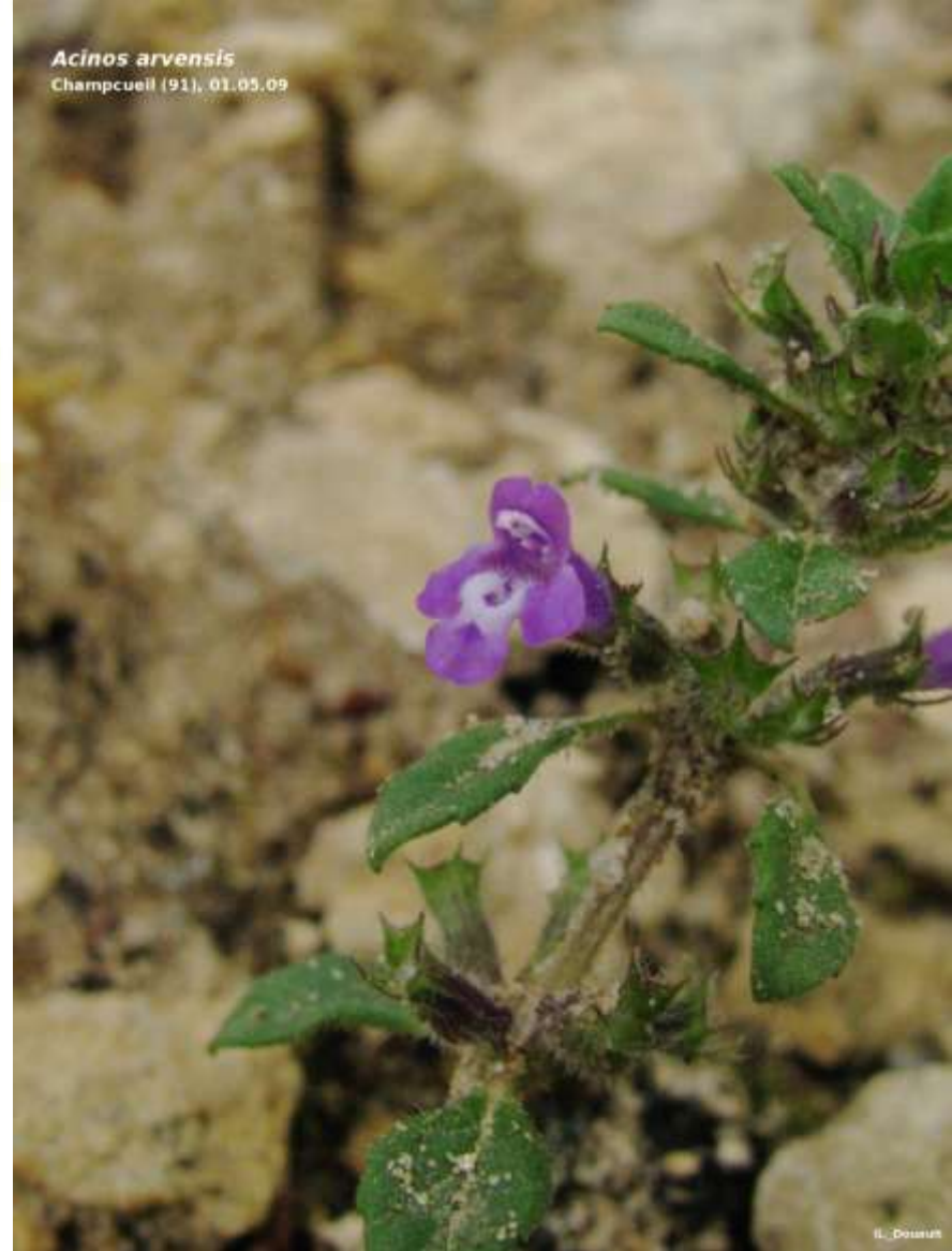
Acinos arvensis Champcuell (91), 01.05.09