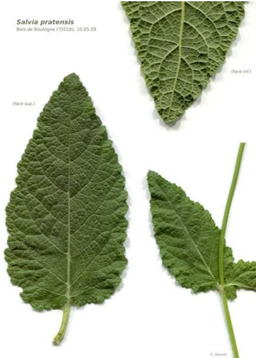
Salvia pratensis Bois de Boulogne (75016), 10.05.09