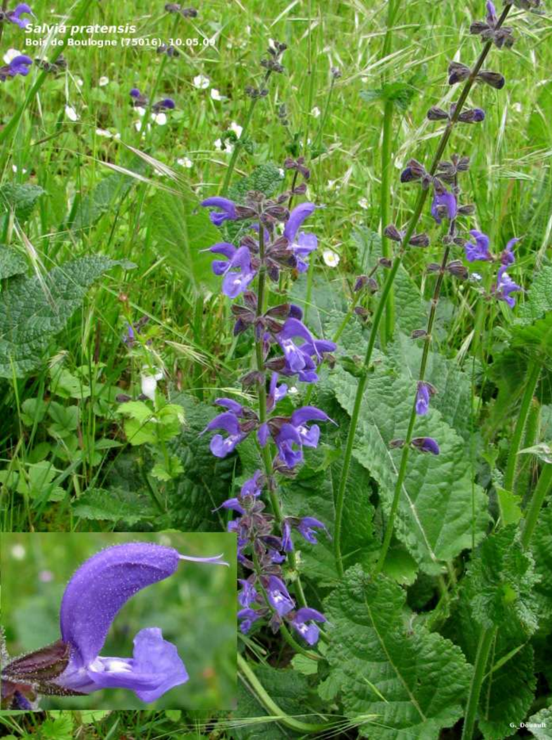
Salvia pratensis Bois de Boulogne (75016), 10.05.09