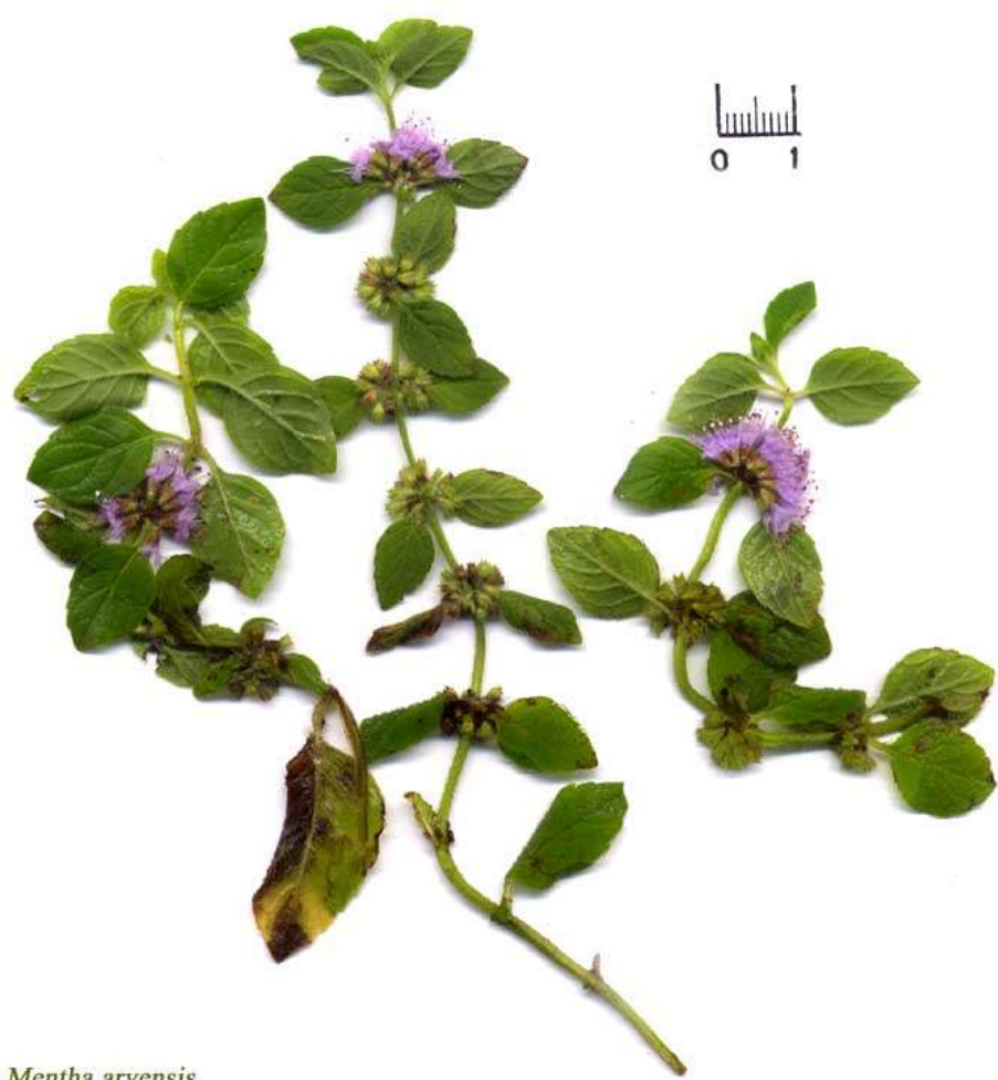
Mentha arvensis S. Blaise, Orsay : 20/09/00