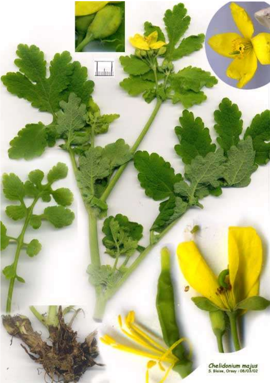
Chelidonium majus S. Bleise, Orsay | 08/03/02