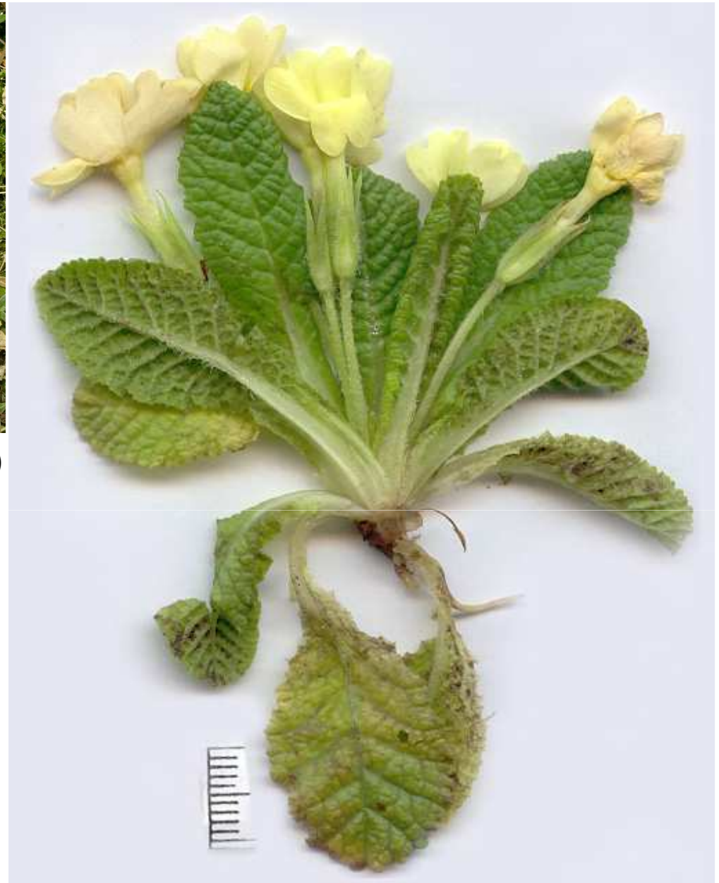
Primevère commune Primula grandiflora Lam.