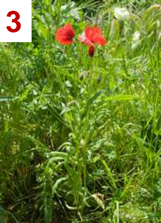
3 Hauteur des plants 20 – 60 cm