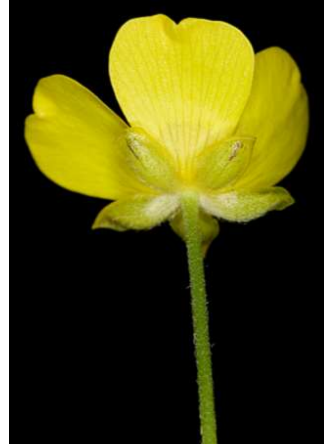
Hauteur des plants 30 – 60 cm